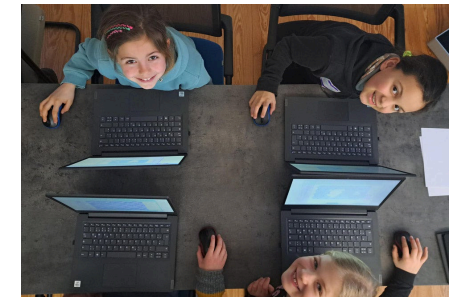
Cobaas – Bildung und Kommunikation e. V.